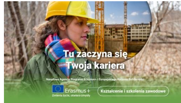
Kształcenie i szkolenia zawodowe